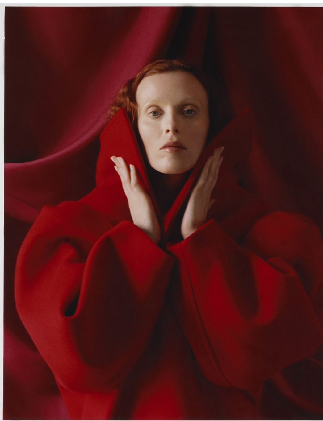
Michael Raveney / Photographer