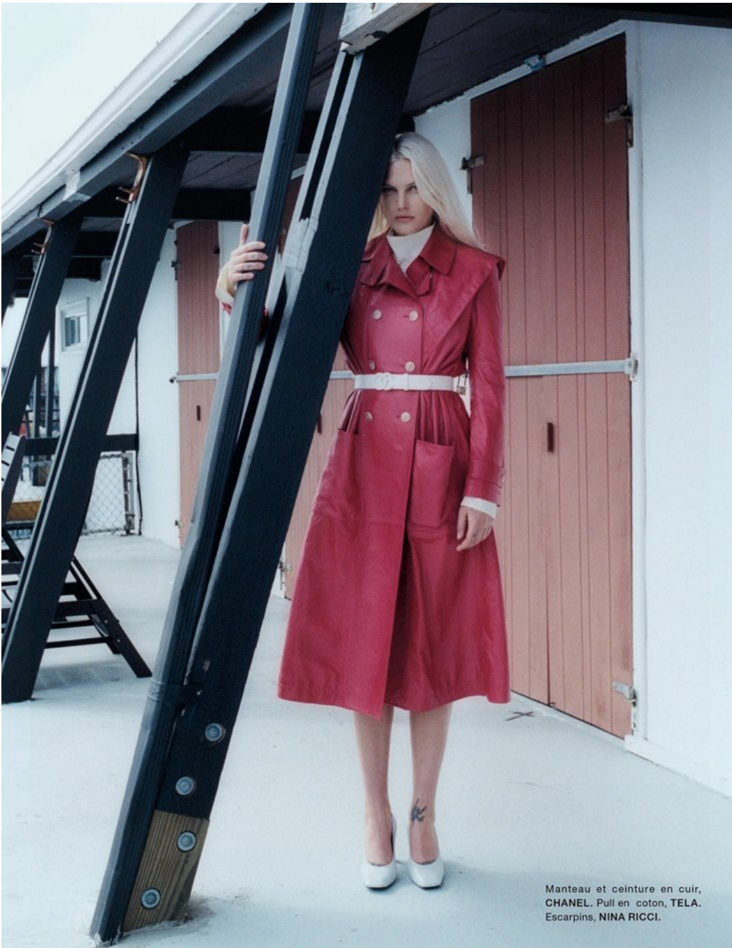
Manteau et ceinture en cuir, CHANEL. Pull en coton, TELA. Escarpins, NINA RICCI.