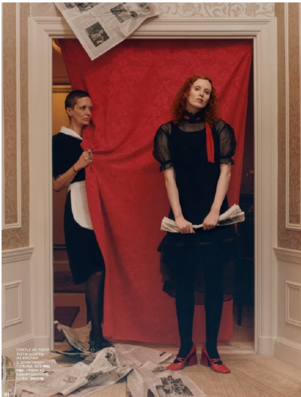
Michael Raveney / Photographer